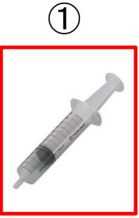
ダラキューロ®が混ざっています