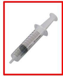
ボルテゾミブが混ざっています