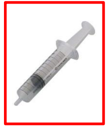
ダラキューロ®が混ざっています